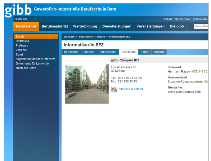
Einsatz Web Part „Schulhäuser“